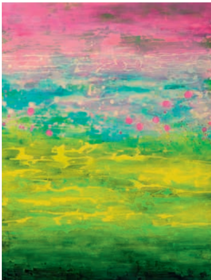
Фото сверху: Abbey's garden, холст, акрил, 160 x 120 см, 2018 г.