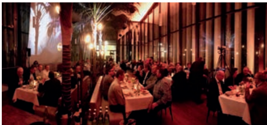
Окончание встречи лидеров в Пальмовом зале Лейпцигского зоопарка.

компаний». По его мнению, конференция Leadership Conference — это первый этап фазы реализации, за которым в 2019 году последуют дальнейшие этапы поступательного внедрения новой архитектуры бренда, а следовательно, позиционирования в рыночной среде с ориентиром на будущее.