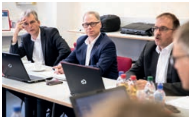
Совещание руководства отдела исследований и разработок 9 октября 2018 года в Карлсштадте.

В дополнение к PIP, мы также занимаемся темой устойчивого развития в рамках частично финансируемых государством проектов с сырьевыми проблемами. К примеру: в проекте «Холодный кирпич» идет речь об изготовлении кирпича из кирпичного боя. Вяжущее вещество для этого должна поставлять компания quick-mix. Мы также исследуем вопрос замены других зернистых и легких заполнителей материалами, извлекаемыми при сносе. Здесь мы целенаправленно готовимся к принятию постановления о замене строительных материалов и в то же время гарантируем себе обеспечение сырьем в будущем.