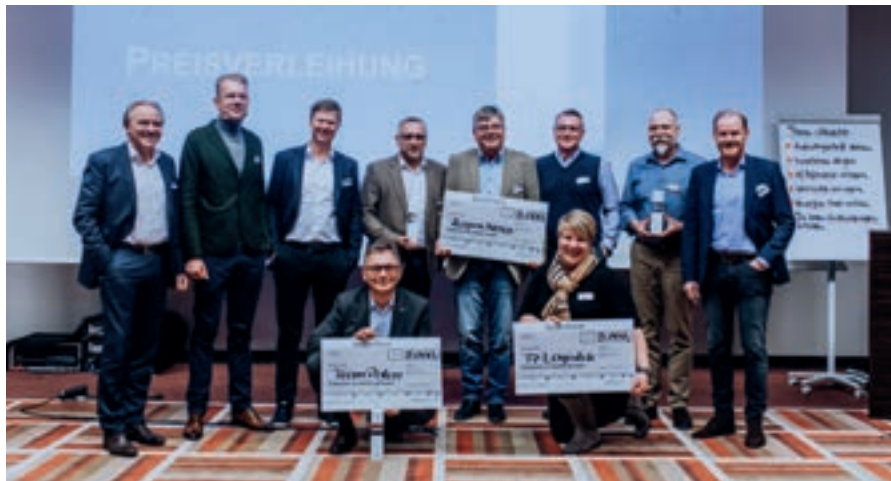
Правление поздравляет исполнителей года — первых лауреатов новой премии.