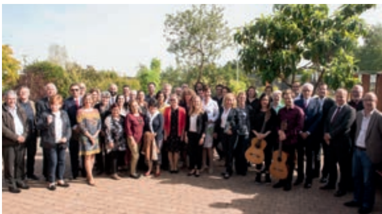
Участники церемонии, которая состоялась в Bohnenkamp-Haus в Ботаническом саду, Оснабрюк.