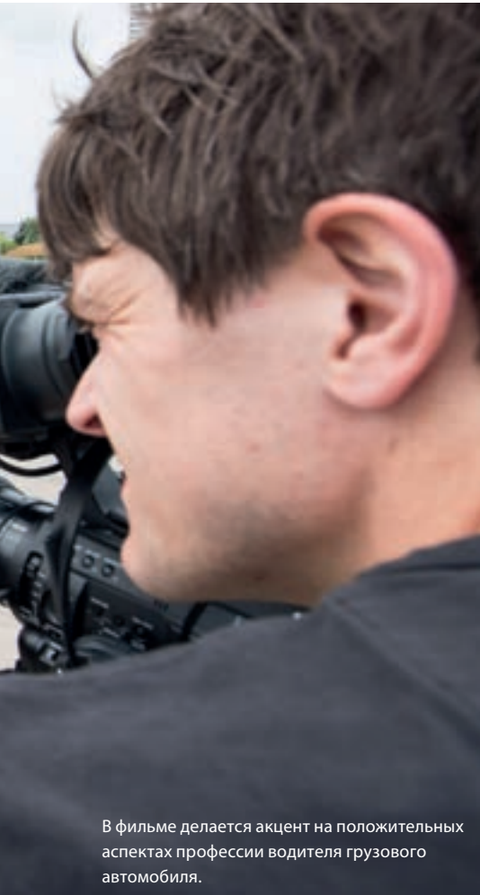
В фильме делается акцент на положительных аспектах профессии водителя грузового автомобиля.