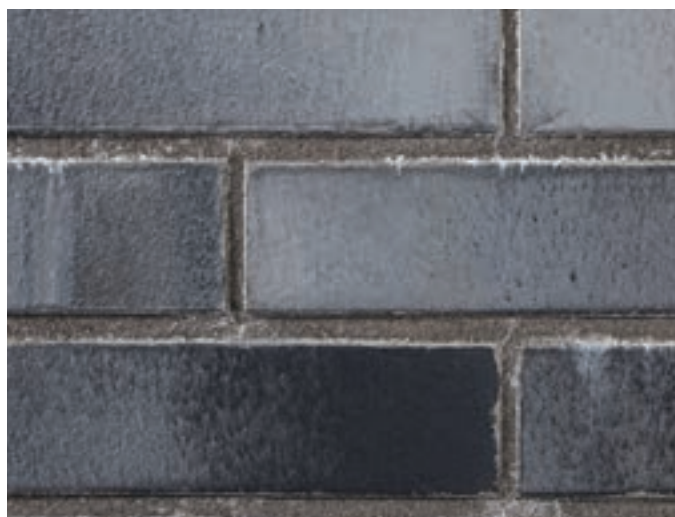
Выщелачивание обычной затирки для швов