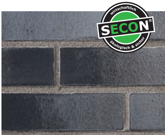
Затирка для швов S-FM