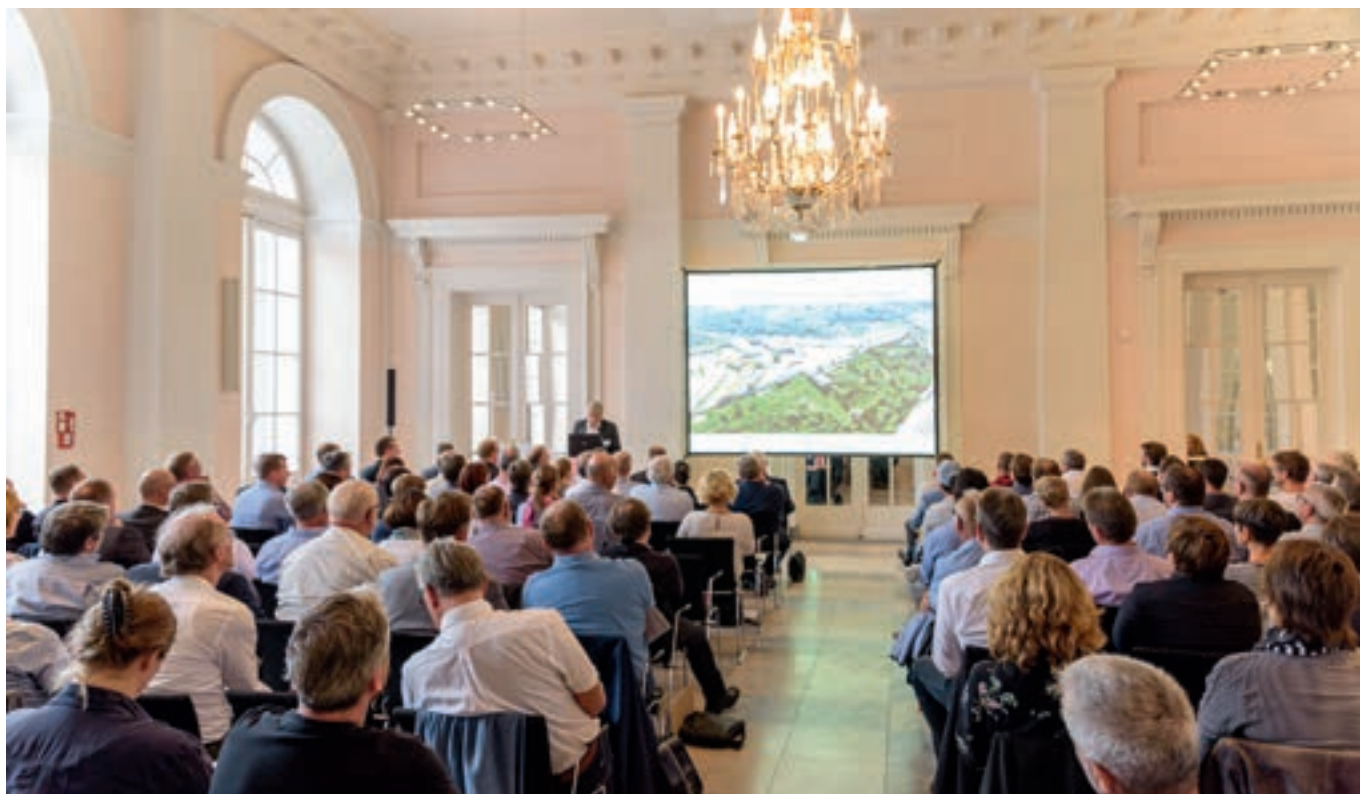
Хороший отклик и в Кобленце — форум по санации, проводимый компанией tubag, давно и надежно занял свое место в расписании широкого круга специалистов.