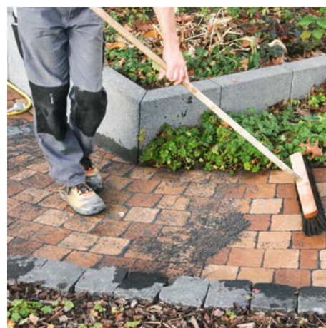
Раствор для заполнения швов брусчатки tubag PFF ProLine наносится классическим методом с заливкой водой.